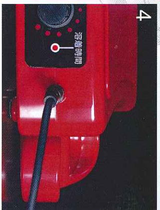
4.出色的防水、防污设计。防止油、水流入到插口。