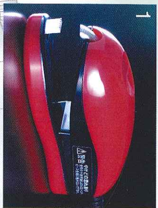
1.符合人体工程学且易于掌握的把手部。