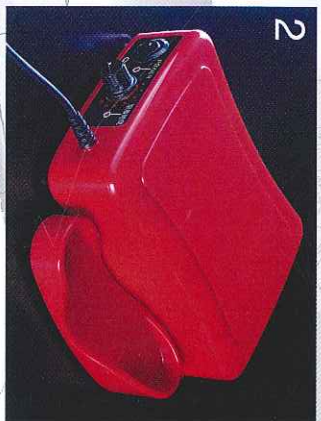
2.标配手持件底座。也可以用磁铁固定在主机上。