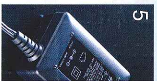
5.采用了AC适配器。在国外也不需要。